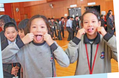
Students are learning English joyfully in a stress-free environment.

Our school hosted an English Fun Day on 25th January. The objective of the English Fun Day was to enhance students' confidence in their English communication skills through extensive interaction with native English tutors. The students and tutors participated in various activities such as singing, playing at game booths and conducting interviews with each other. These activities provided students with a chance to practise their English oral skills in a relaxing