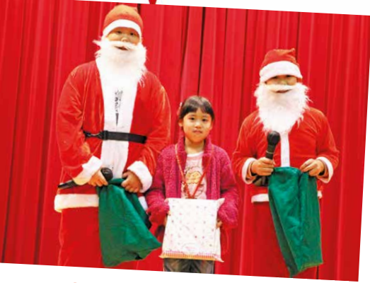
🔷 兩位聖誕老人是當天的特別嘉賓, 他們派發禮物給幸運兒。