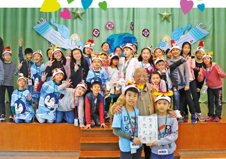
◎ 護老院的老人,答謝我校同學落力表演,為他們帶來歡樂氣氛, 送出紀念品致謝。