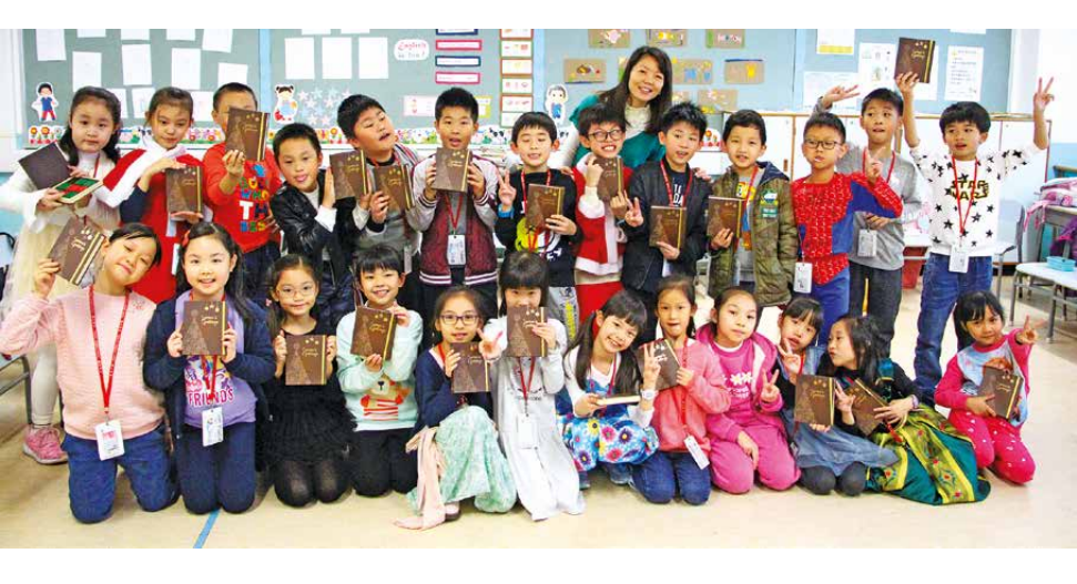
) 課室內的聯歡會多 熱鬧。老師及全班 同學都收到由太古 集團送出的聖誕禮 物,普天同慶。