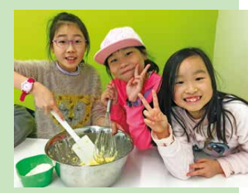
A group of students are making cupcakes.

The English Camp was held from 23rd to 25th January at The Hong Kong Federation of Youth Groups – Jockey Club Sai Kung Outdoor Training Camp. 54 students and 5 teachers took part