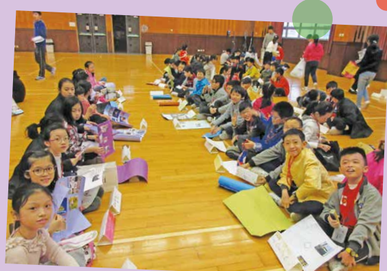
🛆 Students are looking exhausted after the presentations.