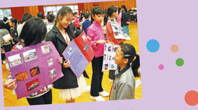
• P.5 students are showcasing their research and posters to P.4 students.