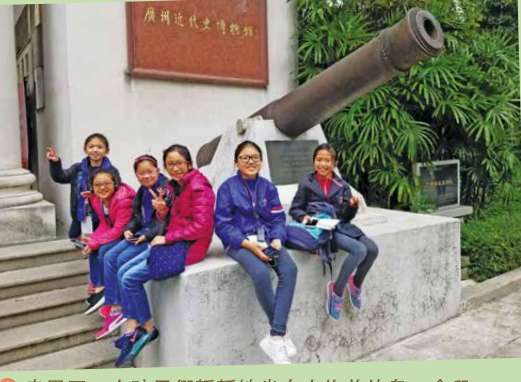
○ 走累了, 女孩子們靜靜地坐在大炮前休息一會兒。